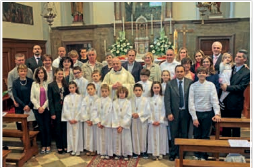
20 maggio 2012. S.Messa di Prima Comunione: i Bambini con Genitori e Familiari, il Parroco e le Catechiste.

Il catechismo non è essenzialmente scuola, anche se sembra averne le caratteristiche. La struttura che può "copiare"